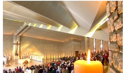
Chapelle Sainte Emérentienne à ND de Vie

Notre futur prêtre a ensuite effectué des retraites à Châteauneuf, Champagne, Notre-Dame de vie à Venasque, près de Carpentras. « J'ai alors fait le choix de m'engager dans le sacerdoce et j'ai poursuivi mes études à l'Institut Notre-Dame de vie et à Fribourg, en Suisse. Puis j'ai été ordonné prêtre en 1992 à Notre-Dame de vie. De là, j'ai été envoyé à Marseille pour être aumônier dans un établissement pendant 14 ans. Pendant ces belles années, je m'occupais des jeunes et institutrices de l'école, du collège et du lycée. Ils m'ont beaucoup appris en termes de pédagogie. J'ai énormément de reconnaissance envers ces laïcs qui m'ont formé. »